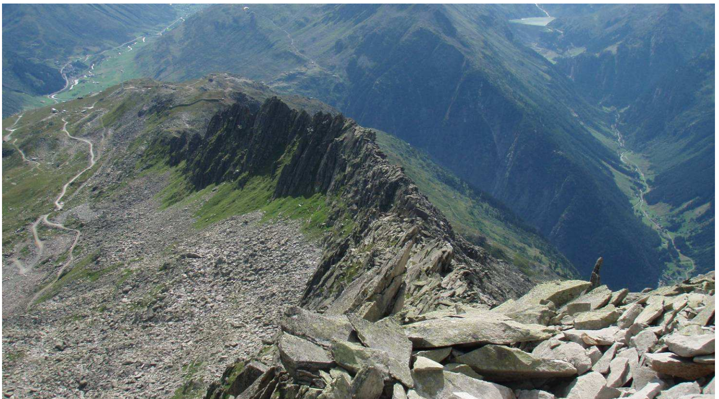
Klein Schijen und SW-Grat des Gross Schijen. Lang , aber schön! Rechts das Göschenertal.

Der Abstieg zurück ist steil und fordert uns nochmals bei zwei Kletter (eigentlich Abseil-) stellen. Um 18.00 Uhr beschliessen wir unsere „Eingetour“ beim Durstlöschen auf dem Nätschen.