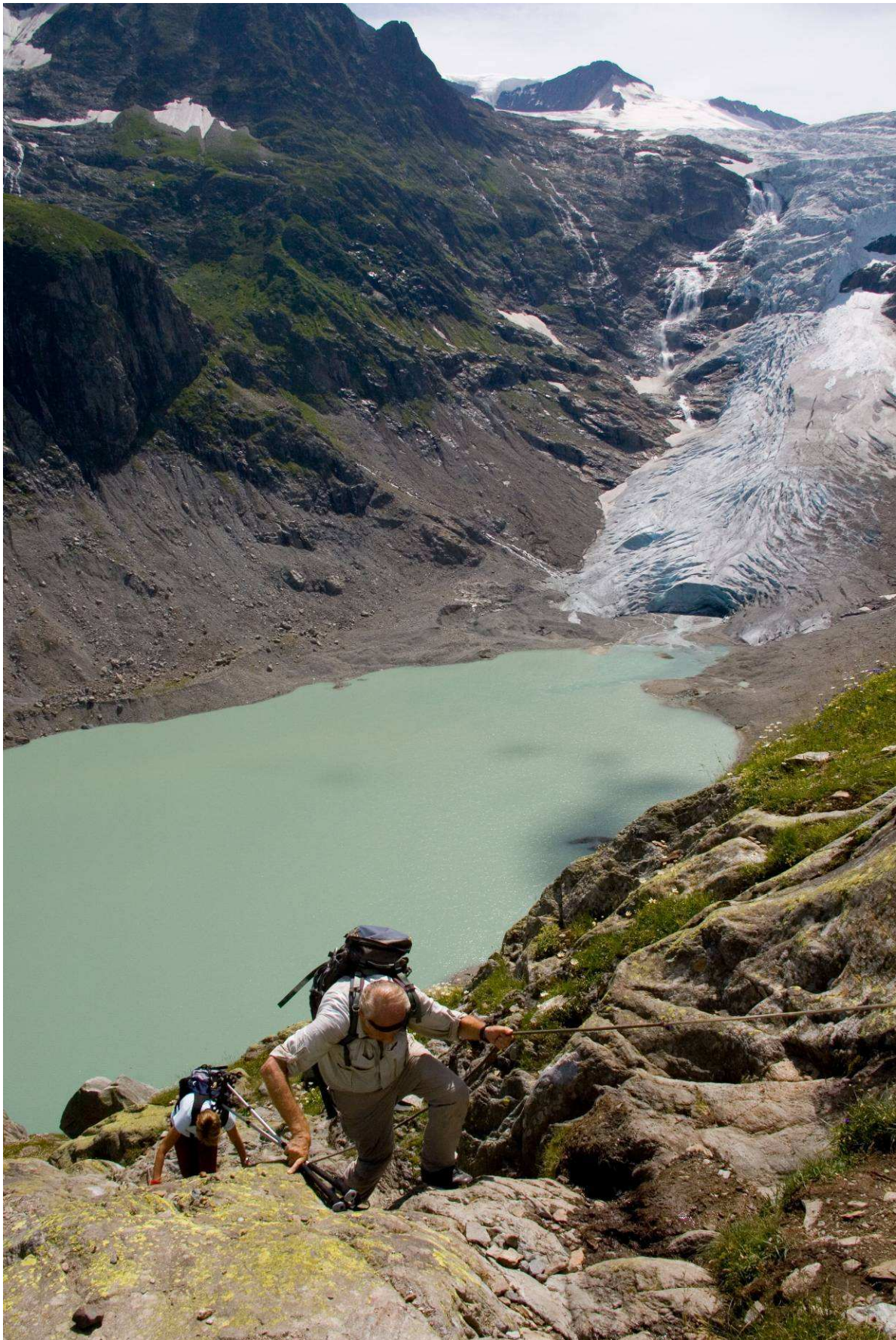
Triftsee und Triftgletscher vom „Ketteliweg“ zur Windegghütte