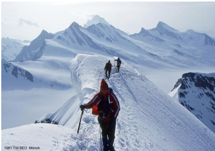
1981 TWBEO Mönch