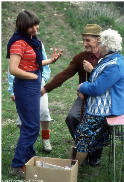
1983 Bözberg - Elfingen